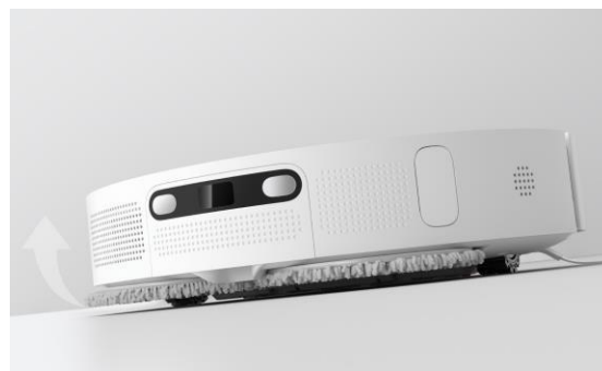
Вращающиеся насадки для швабры с автоматическим подъемом*