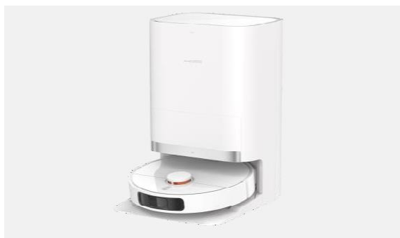
Станция «все в одном»