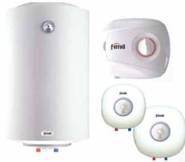
Рис.1. Внешний вид ЭВН

Водонагреватель оборудован штатным сетевым шнуром электропитания с вилкой и УЗО. Электрическая розетка должна иметь контакт заземления с подведенным к нему проводом заземления и располагаться в месте, защищенном от влаги, или удовлетворять требованиям по влаго- и брызгозащищенности. Вставить вилку в розетку и нажать кнопку, расположенную на УЗО ( опционно ).