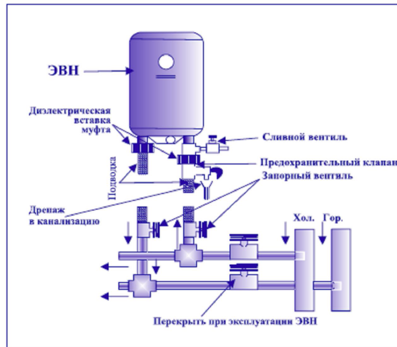
Рис. 2. Схема подключения ЭВН к водопроводу

7.3. При соблюдении правил установки, эксплуатации и технического обслуживания ЭВН и соответствии качества используемой воды действующим стандартам изготовитель устанавливает на него срок службы 10 лет.